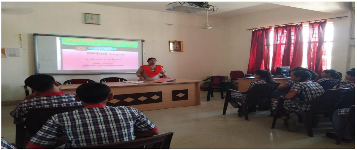
पुस्तक समीक्षा व वाचन कला के विकास का सत्र दिनांक - 26/04/2019