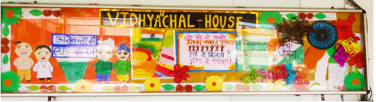
विंध्याचल सदन "अनेकता में एक भारत"