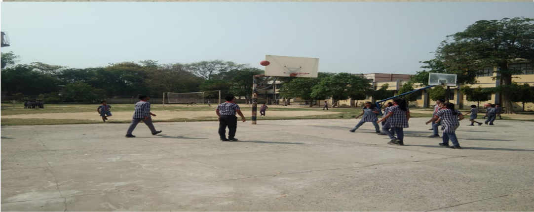
गुरुवार को खेलकूद सत्र का आयोजन शारीरिक शिक्षक द्वारा