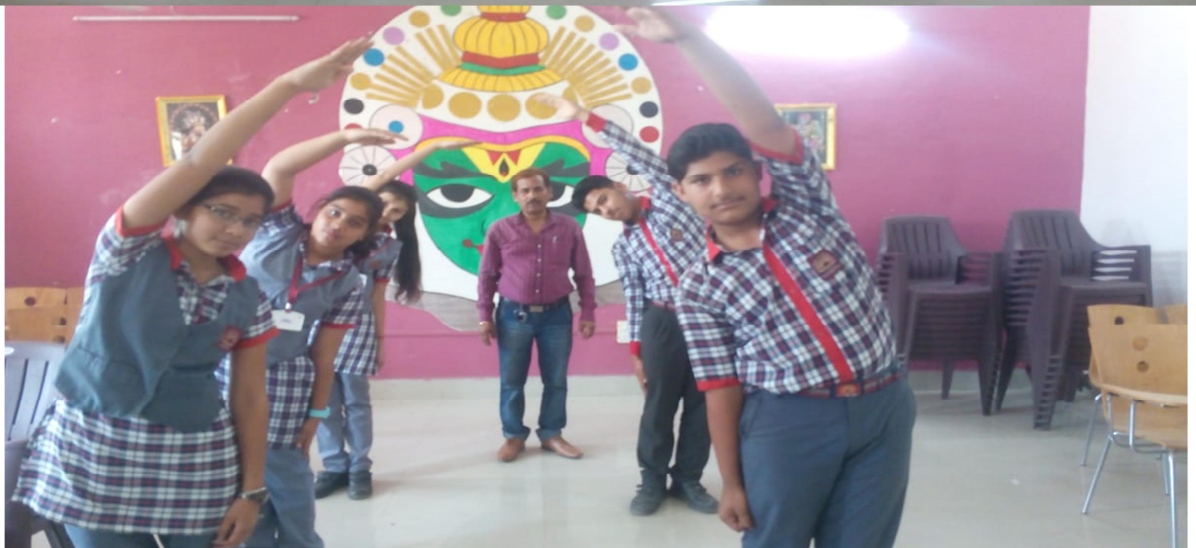
कला सत्र में योग सिखाते योग शिक्षक प्रत्येक शुक्रवार को