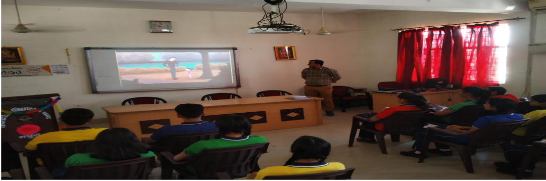
दिनांक 24/04/19 को संगठन द्वारा प्रेषित तरुणोत्सव फिल्म का प्रदर्शन