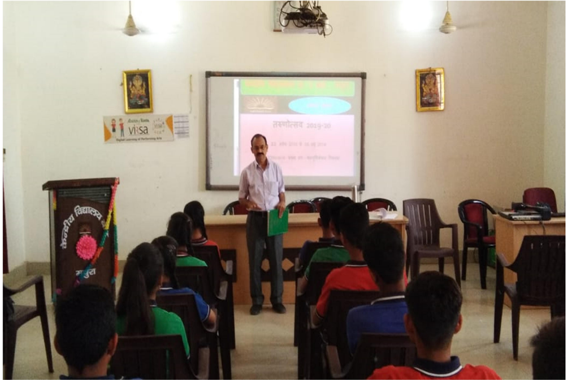
अङ्ग्रेजी विषय मॉड्यूल का प्रदर्शन