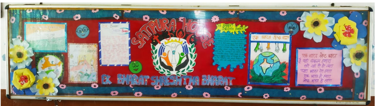
सतपुड़ा सदन "एक भारत श्रेष्ठ भारत"