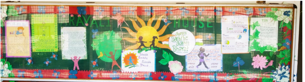
अरावली सदन "स्वस्थ बच्चे स्वस्थ भारत"