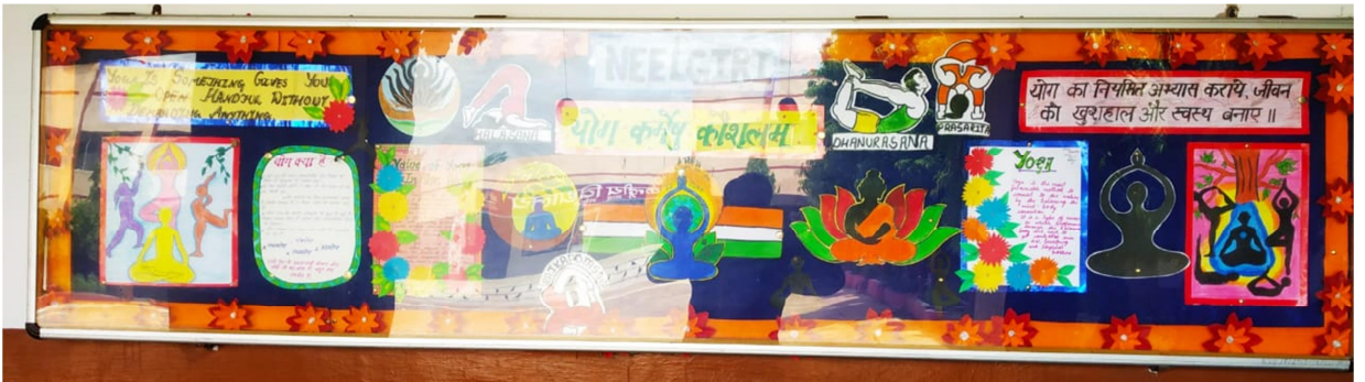
नीलगिरी सदन "योग कर्मषु कौशलम"